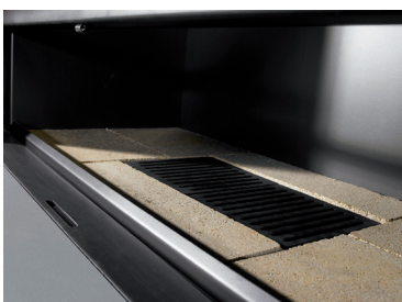
Base de material refractario resistente a 1425° C Cenicero extraíble bajo la reja.