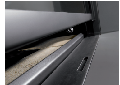
Posicionador apretura Puerta Guillotina. Control regulación Aire Primario.