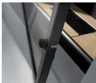
Mecanismo cierre y apertura lateral de la puerta.